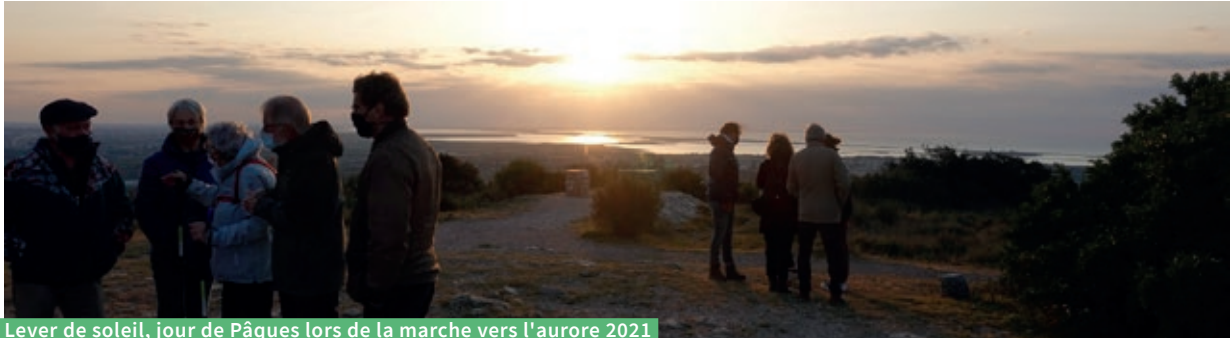
Lever de soleil, jour de Pâques lors de la marche vers l'aurore 2021

Parmi ses tâches, le conseil presbytéral doit gérer les multiples questions qui se posent dans les quatre secteurs. De ce fait, une grande partie des séances est consacrée à la gestion.